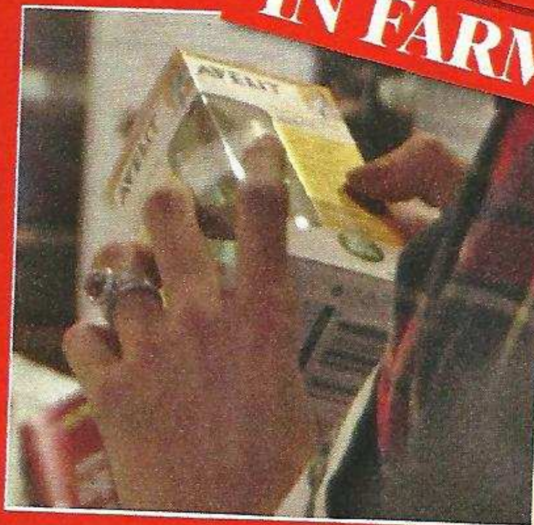
BIBERON Costa 9 euro e 99 ed è della Avent. È un biberon in Pes (polieterstufone) per neonati, riduce al minimo l'aria nella pancia evitando coliche e irritabilità.