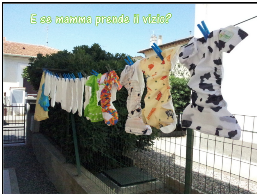
pannolini lavabili stesi ad asciugare

Inoltre il percorso della scelta dei lavabili è anche un percorso interiore perché ti porta a rivalutare molte scelte e aspetti della propria vita. E' anche un percorso di "amore e attenzione" verso i propri figli e verso il mondo che ci stanno dando in prestito. Per prima cosa perché racconterò loro di questa scelta e l'esempio per me è il modo migliore di trasmettere ai figli i valori in cui crediamo. Inoltre il momento del cambio del pannolino è un momento di intimità fra madre/padre e figlio...l'usa e getta è veloce, si cambia e si butta..secondo me riflette il modo di vivere di oggi. Il lavabile si ama, si cambia, si ripone nel secchio, si lava, si asciuga e può diventare anche un momento di gioco colorato quando è il momento di assemblare i pannolini. Se poi si pensa all'attenzione che serve a "fasciare" un neonato con un ciripà è ancora più evidente come questo possa diventare un momento di coccole. In attesa di articoli più dettagliati vi rimando al sito non solo ciripà dove troverete tutte le informazioni utili sui pannolini lavabili. Se avete qualche domanda specifica o vorreste che affrontassi qualche argomento in particolare non esitate a scrivermi, sarò ben felice di farlo!! Io sto aspettando di leggere il nuovissimo libro di Giorgia Cozza Pannolini lavabili che ha già ottenuto ottime recensioni e sono sicura che non deluderà le mie aspettative, visto che Giorgia non è solo una bravissima scrittrice ma è anche (e soprattutto) una mamma che usa i lavabili.