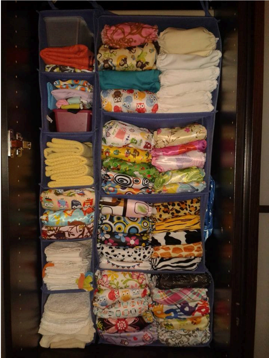
Esempio di come ordinare i pannolini lavabili pronti all'uso