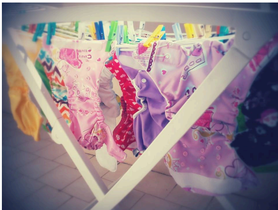
Pannolini lavabili appesi ad asciugare