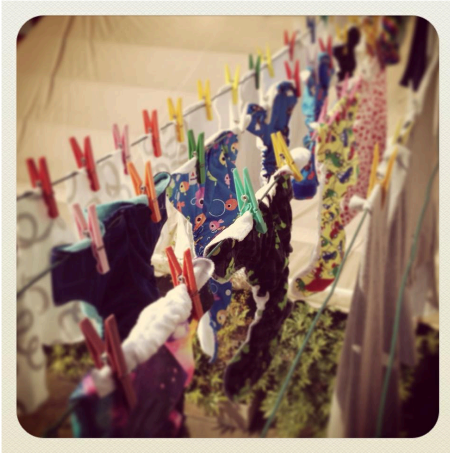
Pannolini lavabili appesi ad asciugare

Una volta asciutti si rinizia il giro. Vi assicuro che tutte queste cose sono più lunghe a dirsi che a farsi...è come se doveste spiegare a qualcuno come fate abitualmente una lavatrice classica di capi in cotone.