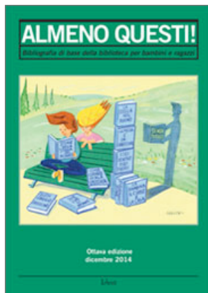
La bibliografia di base per la biblioteca dei ragazzi