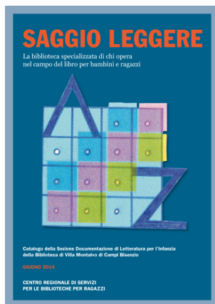
Catalogo della Sezione documentazione di letteratura per l'infanzia della Biblioteca di Villa Montalvo