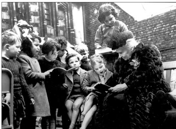
Maria Montessori a Londra, 1951

“Lasciate che i bambini vengano a me e non glielo impedito perch  di essi   il Regno dei Cieli”