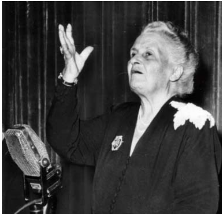
Maria Montessori durante una conferenza, 1949