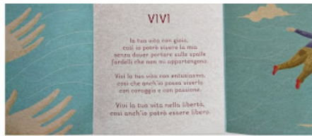
L'ALFABETO del bambino naturale, E. Balsamo, T. D'Incalci, Il leone verde, 2014

Ogni lettera è l'inizio di una poesia che dà voce ai bisogni profondi e più intimi dei bambini, così evidenti, ma spesso così difficili da cogliere per noi adulti. Amami, Benedici, Canta, Mostrami, Parlami..